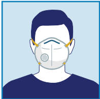
N95 인공 호흡기