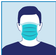
일회용 얼굴 마스크