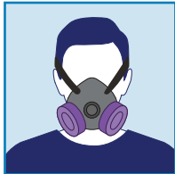
탄성이 있는 인공 호흡기