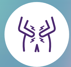
Dolor de estómago