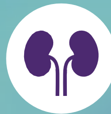
Problemas del riñón