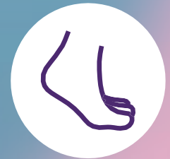
Inflamación del tobillo

Algunas personas experimentan síntomas leves de lupus, pero para otras, el lupus puede poner en peligro la vida. Los síntomas varían de una persona a otra y a menudo se confunden con los de otra enfermedad.