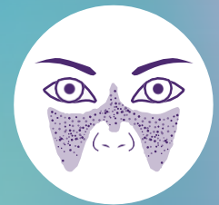
Sarpullido en forma de mariposa